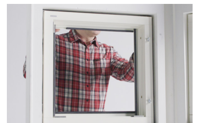
Lyft in fönstret och se till att drevmånerna är detsamma på alla sidor runt om.