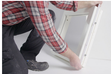
Kontrollera drevmån och välj rätt dimension på TP653 för installationen.