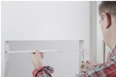
Mät fönster och fönsteröppning.