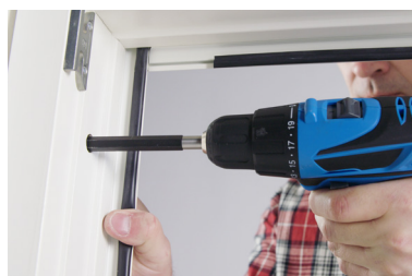
Skruva fast fönstret enligt fönsterleverantörens anvisningar och justera fönstret.