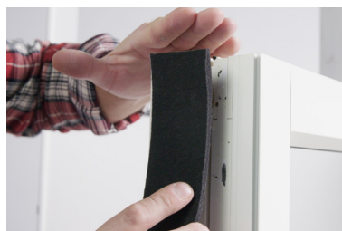
Klistra sedan bandet på de vertikala sidorna av fönstret. Bandet skall vara 2% längre än fönsterkarmens sidor och monteras exakt på fönsterkarmens ned- respektive överkant. Om typ Adjufix, Themahylsa används för montaget, skär ett kryss över hylsan eller använd en hålsåg för att göra hål i bandet. Anpassa storlek och placering på kloss så att den påverkar bandet så lite som möjligt. Säkerställ särskilt tätning emot kloss och att polymerfilmen hålls intakt. (Följ fönstertillverkarens anvisningar om klossar eller distanser används vid fönstermontaget.)