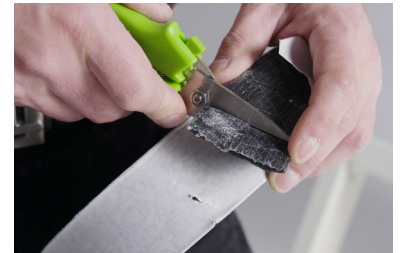
Skär/ klipp av den överkomprimerade första delen av bandet (~25mm), bandet fästs med hjälp av den självhäftande beläggningen.