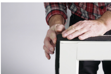
Sist klistras bandet på ovsidan av fönstret. Notera att här skall bandet vara lika långt som det i bottendelen.