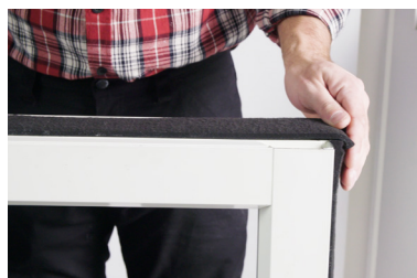
Vik ner överlappen för att underlätta montaget.