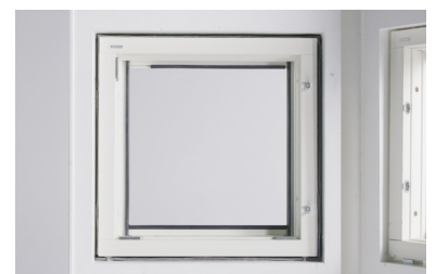
Övergången till tätningen på sidorna måste genomgående utföras så att den är lufttät/ slagregnstät. Vi rekommenderar att hörn tätas med fogmassa, (ex. SP519, SP054).