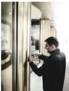
Bits med reducerad skaftdiameter