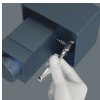
Mini-spärrhandtag för alla svårtillgängliga platser.