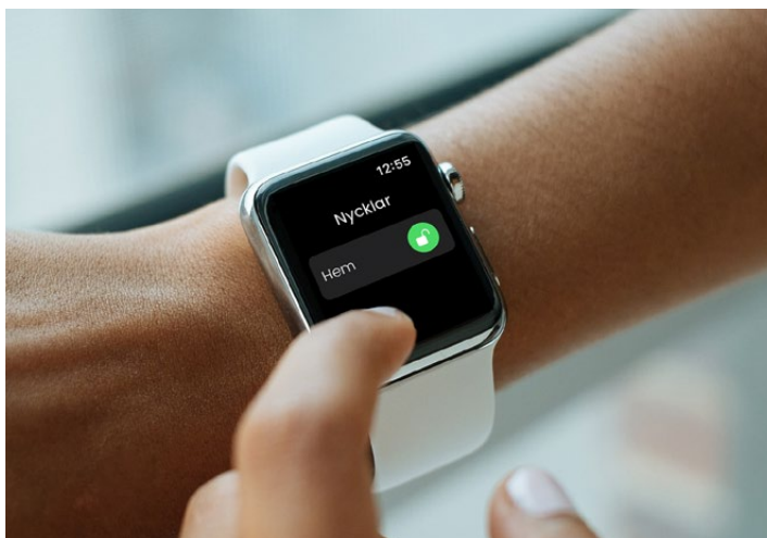
Öppna med dKey-app – finns för både smartphone och smartwatch

dKey är kompatibelt med Google Home och kan kopplas till ditt smarta hem för att se status och styra låsning/upplåsning.