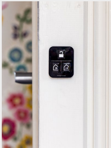
dKey Smart Hem-knapp